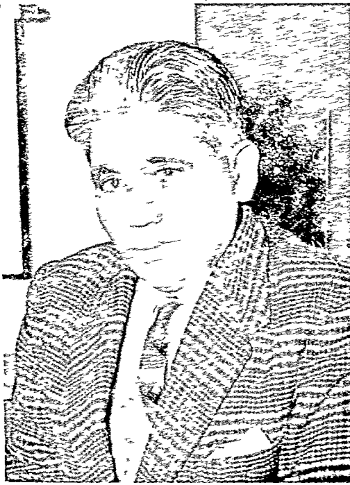
डॉ० शिवमंगल सिंह सुमन